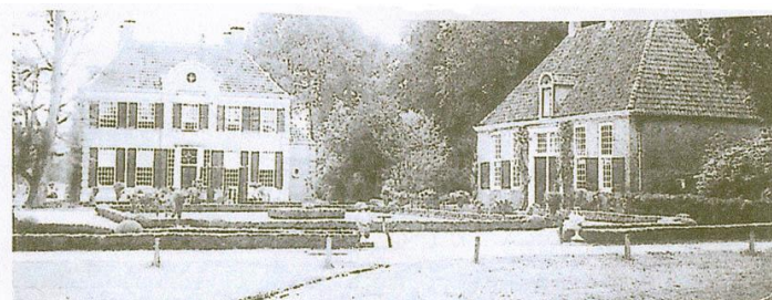
Huize Den Aalshorst.

Vanaf de spoorwegovergang de Heinoeseweg op. Bij Havezathe 'Den Berg' (het Info-bord Havezathe Den Berg staat op de parkeerplaats) rechtdoor de grindweg volgen. Circa 100 m voorbij het weiland aan de linkerkant, linksaf. Vanuit het bos op de klinkerweg rechtdoor. Op de asfaltweg rechtsaf, Heinoeseweg. Bij een monumentaal toegangs-hek rechtsaf het Aalshorsterpad op. Aan het einde linksaf de asfaltweg op. Nu langs het kasteel. Op de asfaltweg rechtdoor en in een rechtse bocht, linksaf de halfverharde weg volgen. Op een splitsing voor een weiland rechts aanhouden en aan het einde van dit pad met een bocht mee naar links. Na 50 m op een vijsprong het pad stomp rechts kiezen tot een heuvel met een huisje erop. Linksom de heuvel heen en het pad rechtdoor kiezen. Aan het einde van de boslaan stomp linksaf over een aarden wal met voetgangerssluis en op de brede onverharde weg rechtsaf. Aan het einde rechtsaf de bosrandweg volgen. Bij Y 13190 rechtsaf de Heinoeseweg op. Voor u ziet u Herberg de Witte Gans.